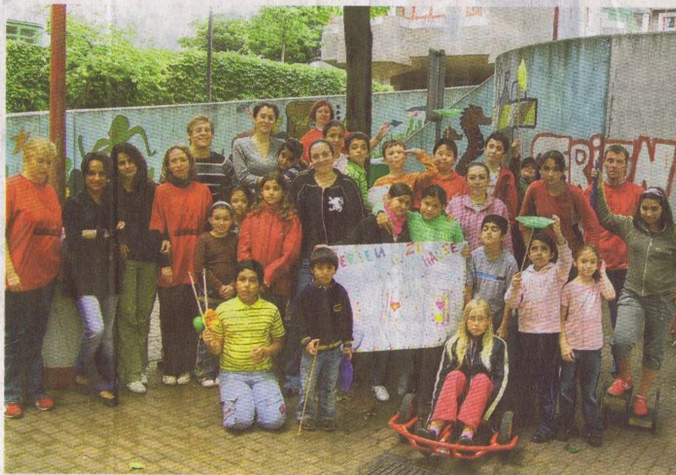
Zahlreiche Kinder im Alter von sechs bis 16 Jahren machten in Chorweiler „Ferien zu Hause“.

jeden Tag zur Arbeit gehen. Damit die Kinder nicht alleine und gelangweilt zu Hause herumsitzen, organisierte der Jugendmigrationsdienst Köln mit dem Förderverein