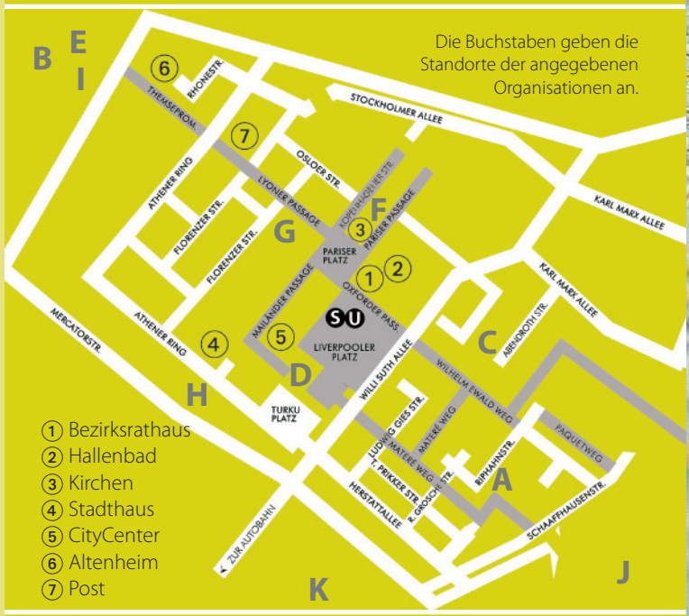
Die Buchstaben geben die Standorte der angegebenen Organisationen an.

Idee & Umsetzung: Interkultureller Dienst Chorweiler (Stadt Köln) Mit finanzieller Unterstützung durch die Koordinations- und Anlaufstelle für sozialraumorientierte Hilfen Köln im Bürgerzentrum Chorweiler (Stadt Köln). Vi.S.d.P.: Deutsch-Türkischer Verein Köln (DTVK) e.V. www.der-werbeberater.de Ulif Stecher Werbeberatung